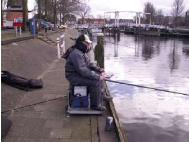
Wintervissen in de haven van Harderwijk 2013.

Onderstaand nog een paar foto's uit de oude doos.